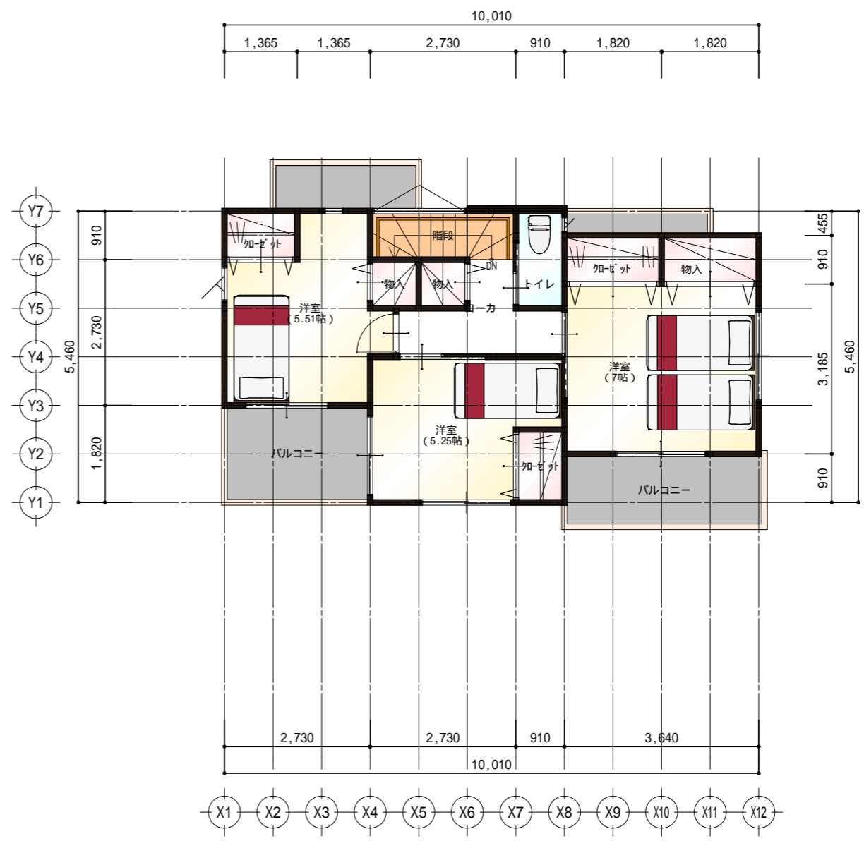
2階 平面図 S:1/100

大井 伸之 高橋 文雄 滝澤 登志雄 鳥潟 正浩 柴田 秀浩 小林 正 渡辺 一洋 中村 之一