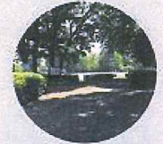
富士見公園 徒歩1分(約80M)