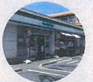
コンビニ 徒歩5分(約400M)